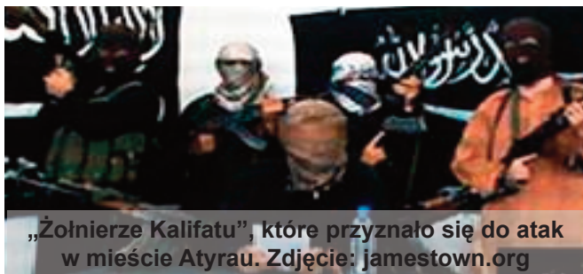
„Żołnierze Kalifatu”, które przyznało się do atak w mieście Atyrau.

Warto zauważyć, że natychmiast po uchwaleniu nowej ustawy przez Parlament Kazachstanu, w Internecie pojawił materiał wideo z apelem ugrupowania „Żołnierze Kalifatu”, które wysunęło żądanie natychmiastowego zniesienia ustawy, a kilka tygodni później przyznało się do zamachów bombowych w mieście Atyrau w dniu 31 października [13].