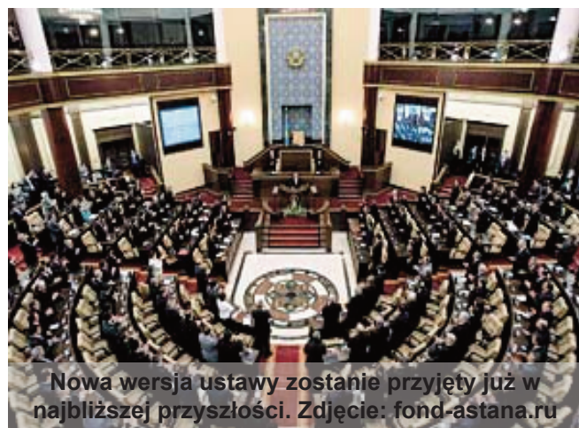
Nowa wersja ustawy zostanie przyjęty już w najbliższej przyszłości.

nego partnera i państwa pokojowego. W maju, pod budynkiem Komitetu Bezpieczeństwa Narodowego został wysadzony w powietrze samochód. Potem był wybuch bomby w budynku służb specjalnych w Astanie. W lipcu, w pobliżu miasta Aktobe zostało zabitych dziewięć osób, podejrzanych o przynależność do tajnych organizacji radykalnych. Pod koniec października dokonano dwóch zamachów bombowych w Atyrau [5]. W kręgach ekspertów uważa się, że „przyczyną wybuchów są podejmowane przez władze nieustanne próby ustanowienia szerokiej kontroli nad organizacjami religijnymi”. Należy zauważyć, że według Raportu rządu USA o wolności religijnej za okres lipiec-grudzień 2010 r., „państwo nie ograniczało wolności wyznania większości zarejestrowanych grup religijnych, a jednocześnie zapewniało przestrzeganie obowiązujących restrykcji w stosunku do grup niezarejestrowanych i innych ugrupowań mniejszości religijnych. Żadnej apolitycznej grupie religijnej nie zakazano prowadzenia działalności” [6]. Ta opinia amerykańskich ekspertów potwierdza polityczne umotywowanie przyjęcia takich przepisów.